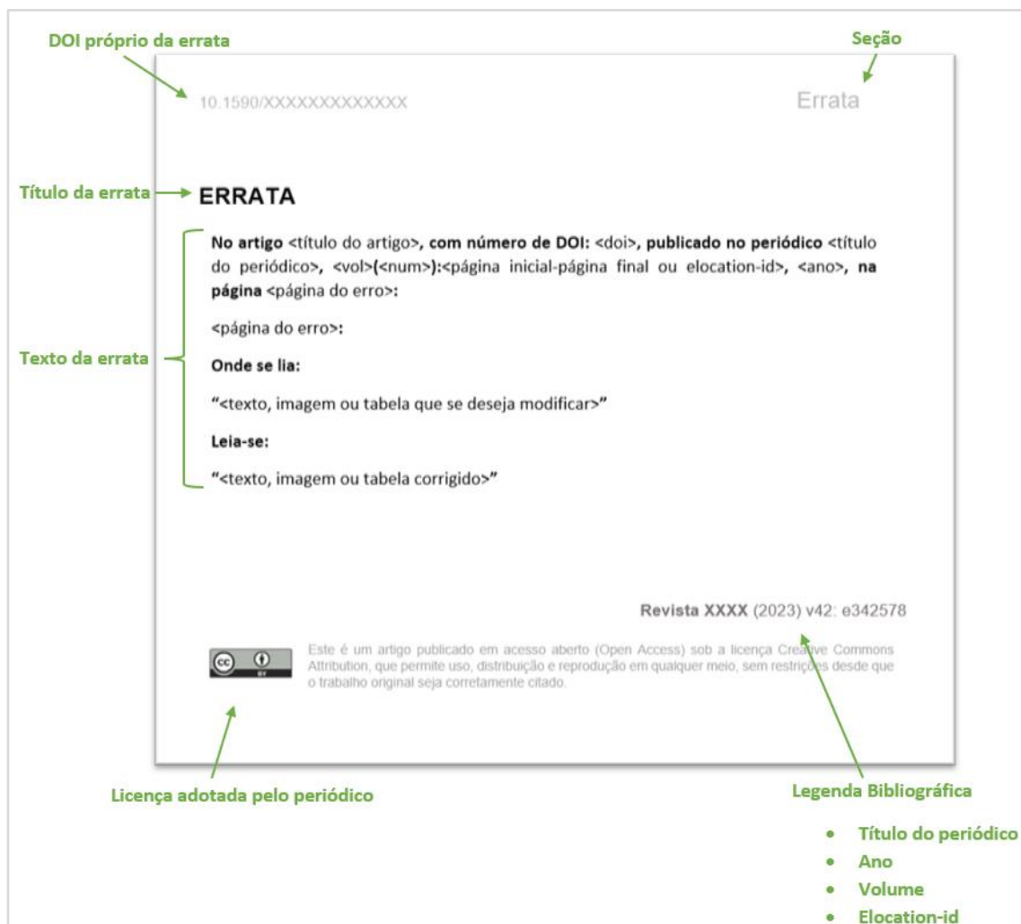
Figura 4: Exemplo PDF da errata