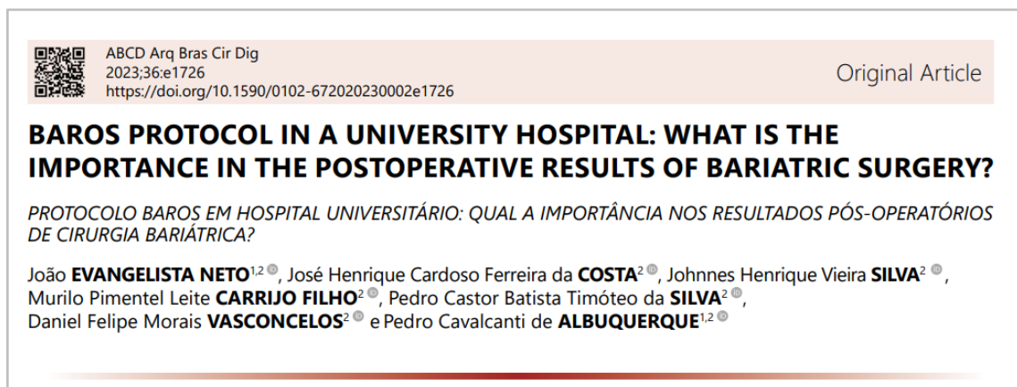
Figura 2: Sobrenome negrito e caixa alta