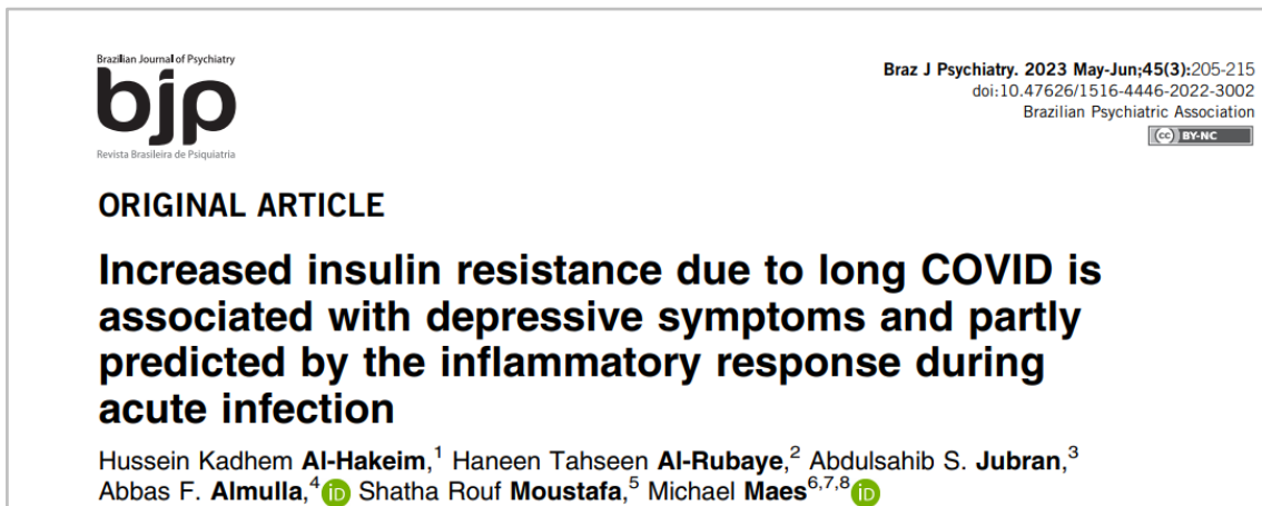
Figura 1: Sobrenome negrito