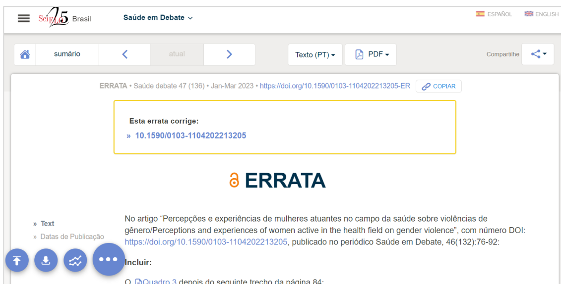
Figura 4: Exemplo da página da Errata

Disponível em: https://www.scielo.br/j/sdeb/a/z3YsKYhCtxnqmvdrLQD6MN/?lang=pt