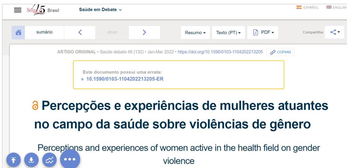
Figura 5: Exemplo da página do documento mencionado pela errata

Disponível em: https://www.scielo.br/j/sdeb/a/kBkzMDZQV9yQKq8VH7csFjv/?lang=pt