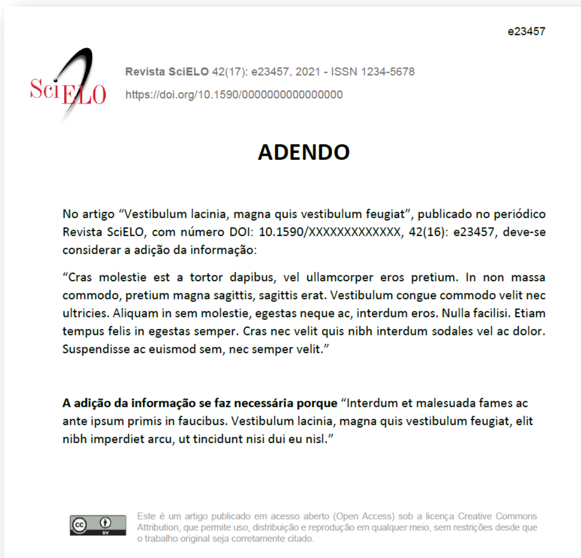
Figura 1 – Modelo PDF de Adendo